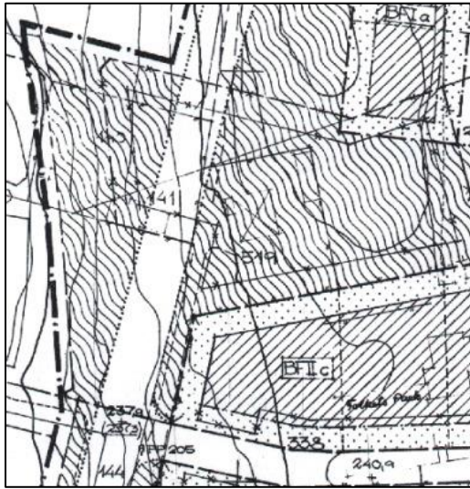
Figur 3: Utdrag ur befintlig detaljplan

Planområdet är detaljplanerat sedan tidigare i Ändring och utvidgad stadsplan Spångenområdet m.m. (plannummer 59) från 1974. I detaljplanen pekas markanvändningen för Eksjöhovgård 7:11 ut som allmän platsmark park och plantering.