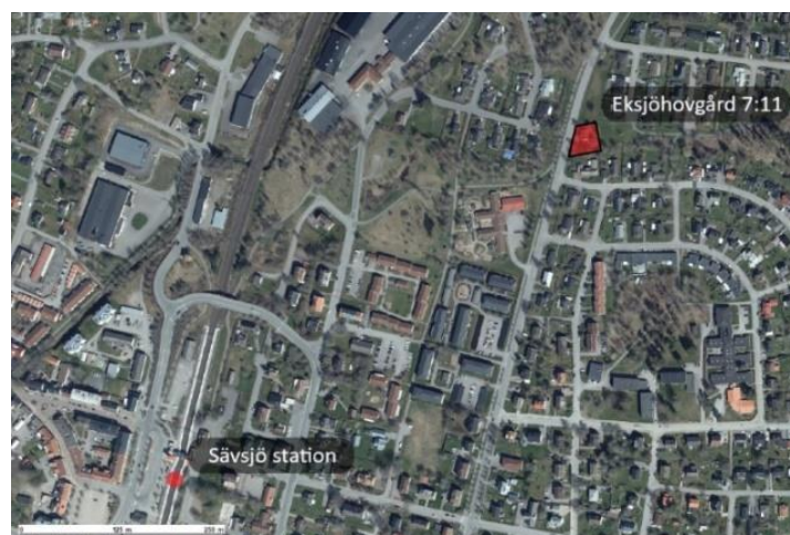
Figur 1: Planområdets position i Sävsjö

Planområdet ligger på en höjd med utsikt över tätorten. I nära anslutning finns även förskola, större och mindre lekplatser, grönområden, motionsspår och andra faciliteter.