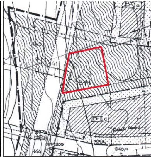
Figur 4: Ungefärligt planområdet markerat i rött

Under det nya användningsområdet kan man se den befintliga byggnaden med tillhörande komplementbyggnad tillsammans med ungefärliga fastighetsgränser. I planbeskrivningen nämns stadsägan 519, vilket är fastigheten som idag heter Eksjöhovgård 7:11, endast som en villabyggnad från ca 1920-talet jämte uthus som ligger inom föreslaget grönområde.